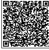
Portal Ministerio De Hacienda

Cód. de generación: DA6AB3DF-F2A6-064F-B8CA-774F8673F5D7 Número de Control: DTE-03-M001P001-00000000000086 Sello de recepción: 20266A8D67B411864B3285140D51A6D43743HEPE Modelo de facturación: Previo Tipo de transmisión: Normal Fecha: 01-06-2026 Hora: 10:16:49 AM